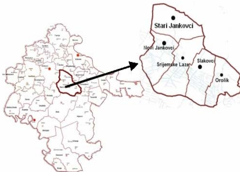
Kartogram 1 POLOŽAJ OPĆINE U ŽUPANIJI

Općina Stari Jankovci svojom ukupnom površinom zauzima 3,89 % prostora Županije.