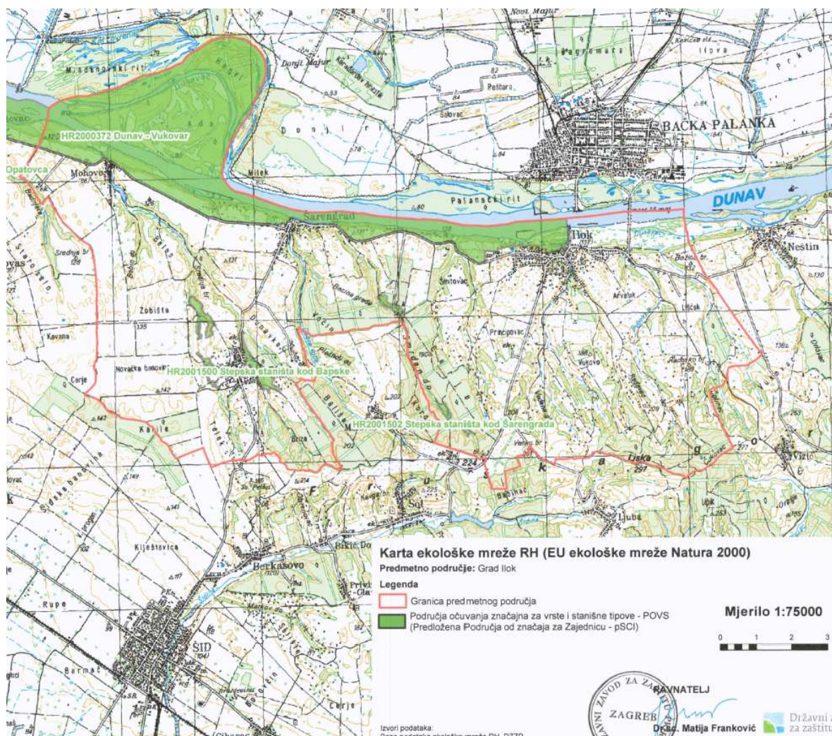
Prikaz 2 Karta ekološke mreže za područje Grada Iloka

Vezano uz ciljeve II. izmjena i dopuna PPUG Iloka – lociranje vjetroparka na području „Radoš“ i određivanje lokacija reciklažnih dvorišta sukladno Zakonu o održivom gospodarenju otpadom uvjeti zaštite prirode su: